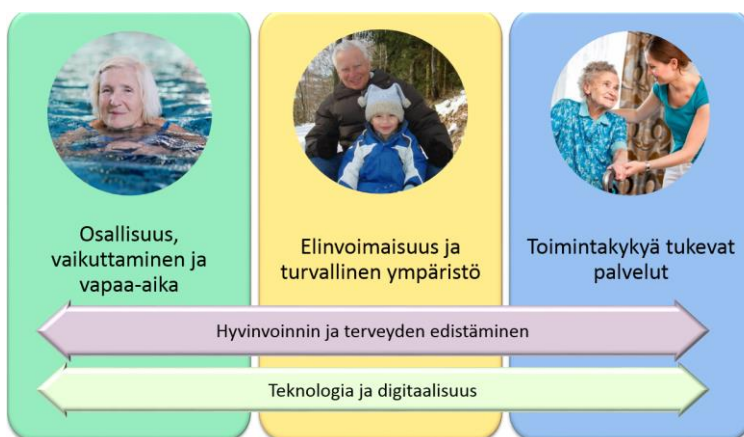
Kuva 3. Ikääntyneiden hyvinvointisuunnitelman painopisteet vuosille 2018–2019.

Jokainen teema sisältää hyvinvoinnin ja terveyden edistämisen sekä teknologian ja digitaalisuuden näkökulmat, joista muodostuu painopisteet (kuva 3). Suunnitelman liitteenä on tavoite- ja toimenpidesuunnitelma, jonka toteutumista seurataan ja arvioidaan kaupungin toiminnan raportoinnin yhteydessä.