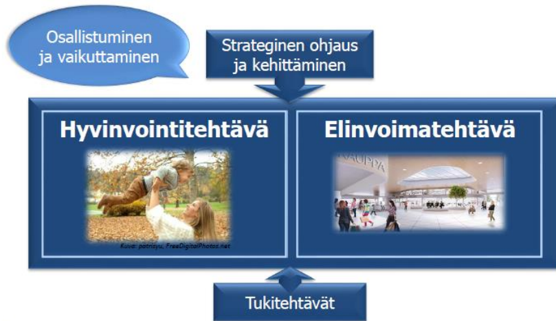
Kuva 2. Järvenpään kaupungin perustehtävät sekä strateginen ohjaus ja tuki

kokoussa 2017 hyväksytty Järvenpään kaupungin ydin- ja tukiprosessit (kuva 2), jossa painopisteinä ovat hyvinvointi ja elinvoimaisuus sekä osallistuminen ja vaikuttaminen. Tämä Ikääntyneiden hyvinvointisuunnitelma on osa kaupungin strategiaa ja sen keskeiset linjaukset on laadittu kaupunkistrategian pohjalta.